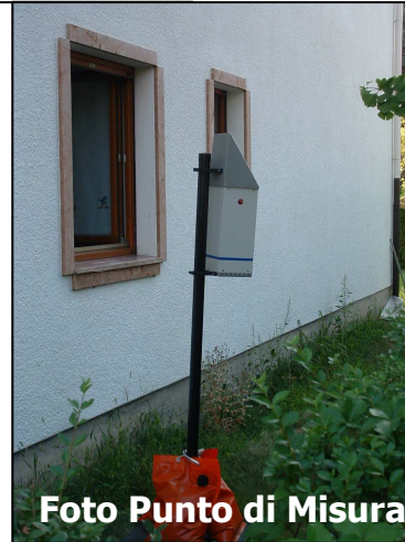
Foto Punto di Misura