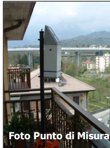
Foto Punto di Misura