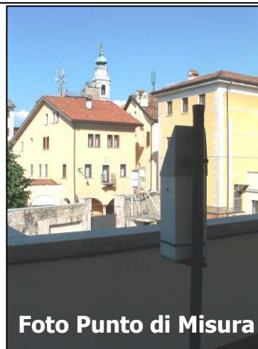
Foto Punto di Misura