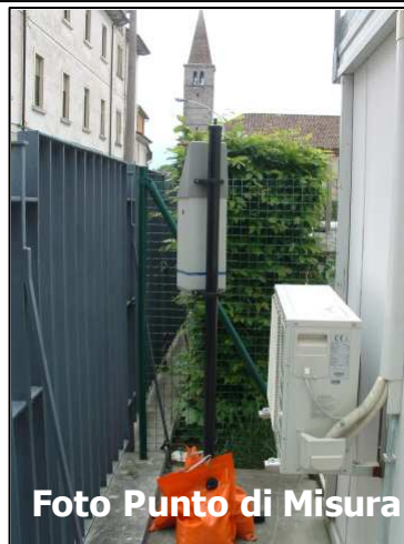
Foto Punto di Misura