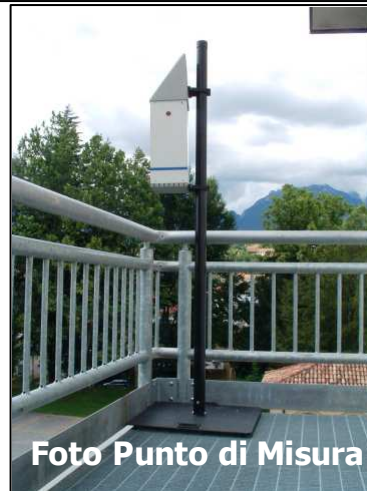
Foto Punto di Misura