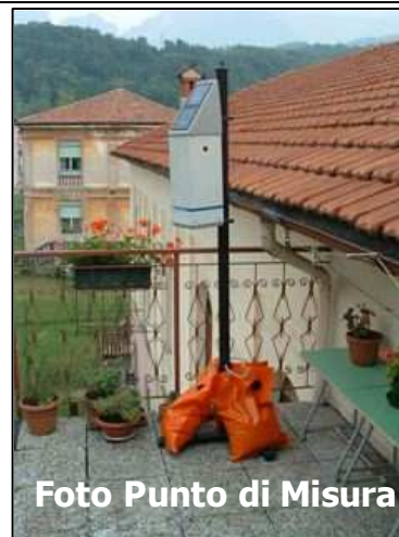
Foto Punto di Misura