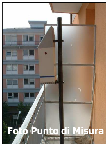
Foto Punto di Misura