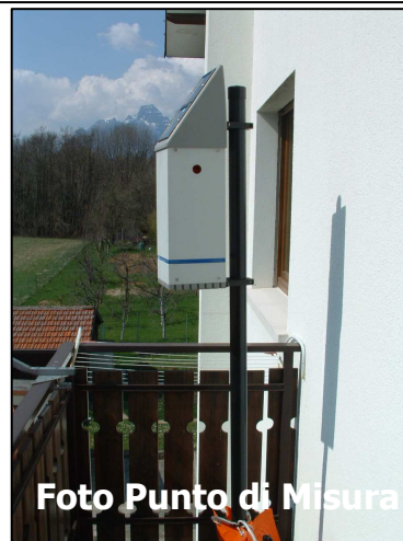
Foto Punto di Misura