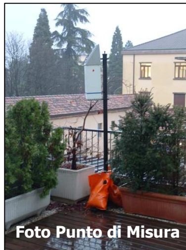
Foto Punto di Misura