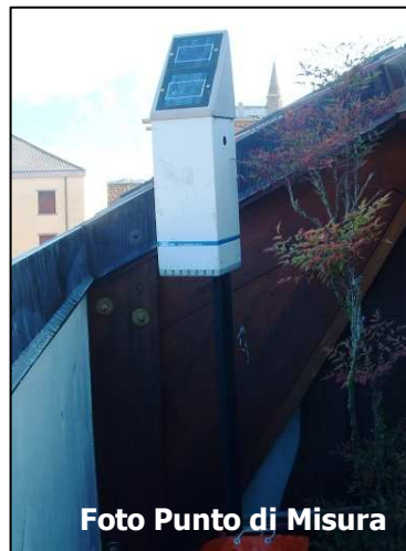
Foto Punto di Misura