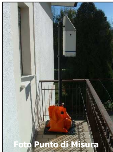
Foto Punto di Misura