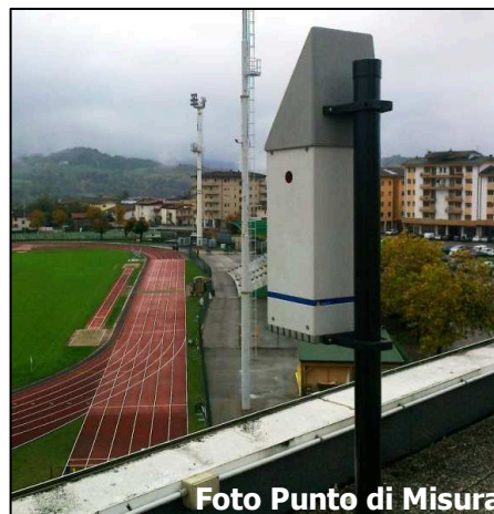
Foto Punto di Misura